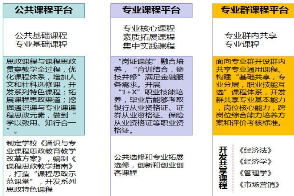
图2 “岗证课能”融合金融管理专业课程体系