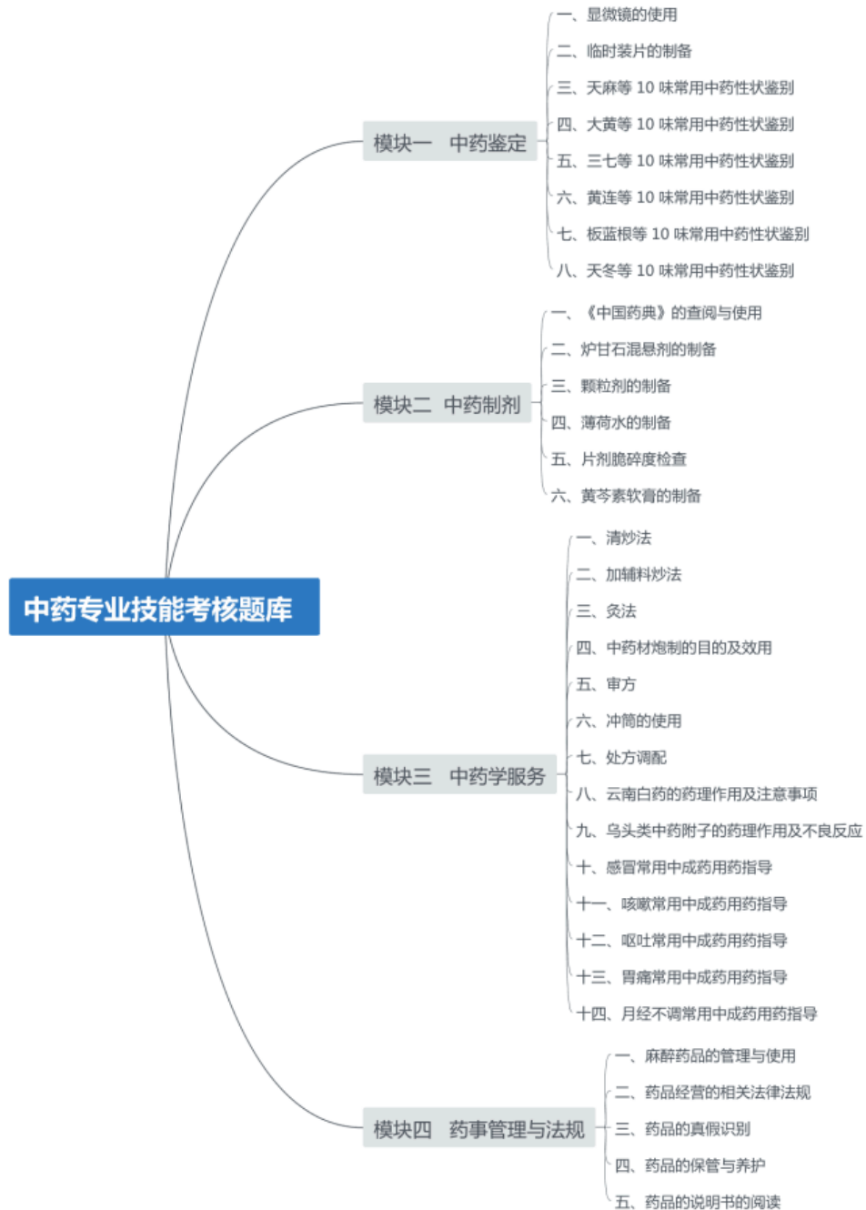
图 3-1 专业技能考核内容

常见各类药材的性状鉴定 8 个基本操作项目；中药制剂模块包括中国药典查阅和各类常规剂型的制备 6 个基本操作项目；中药学服务包括中药炮制、中药调剂、中药药理、常见中成药用药指导共计 14 个基本操作项目；药事管理包括药品真假识别等 5 个基本操作项目。本题库共计 33 个项目（33 个试题），所有考核试题的集合组成考核题库。