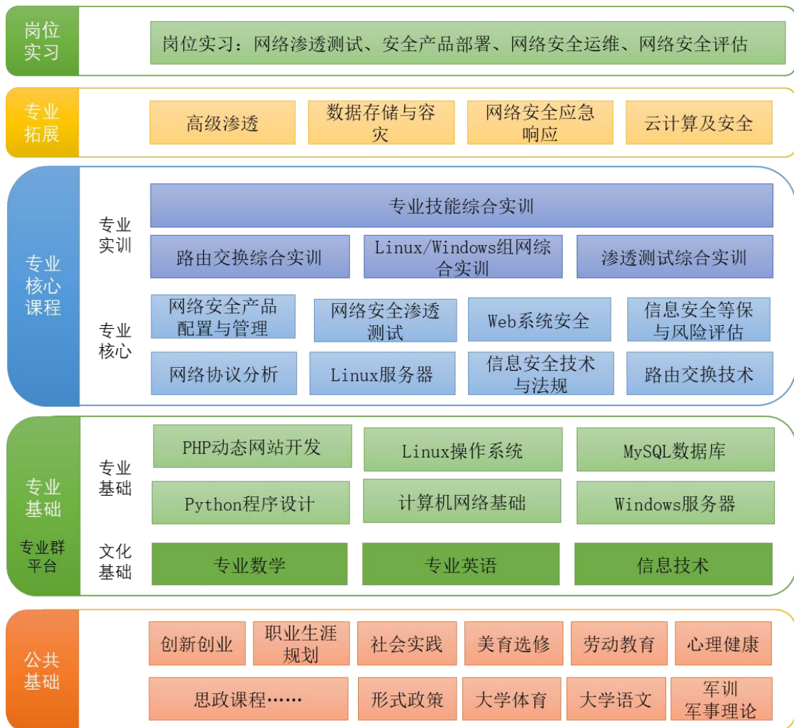
图 2 课程结构图

本专业课程以工作岗位的职业能力为依据进行分析与设计，依据各岗位的特殊性分别设计其对应的核心课程，同时结合职业发展方向设计专业拓展课程。