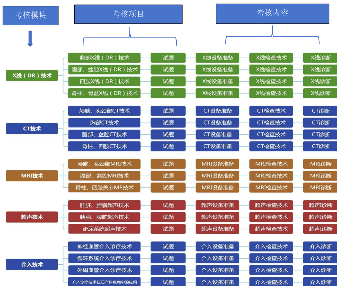
图 1 技能考核模块、项目和内容结构图

医学影像技术专业技能考核分为 X 线（DR）技术、CT 技术、MR 技术和超声技术、介入技术 5 个模块，对应本专业 5 个典型岗位。X 线（DR）技术模块编制了 8 道考核试题，CT 技术模块编制了 8 道考核试题，MR 技术模块编制了 7 道考核试题，超声技术模块编制了 7 道考核试题，介入技术模块编制了 4 道考核试题。每道考核试题都包括设备准备（检查前）、检查技术（检查中）、影像诊断（检查后）3 种技能考核内容。所有考核试题的集合组成考核题库。考核模块、项目和内容见图 1。