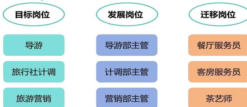
图 1 职业发展路径图